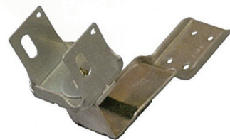
ソーラーパネル用支持金具

J形瓦屋根に太陽光パネルを設置するとき、瓦のズレによる雨漏りや破損を防止するために「シジカ」をお使いください。